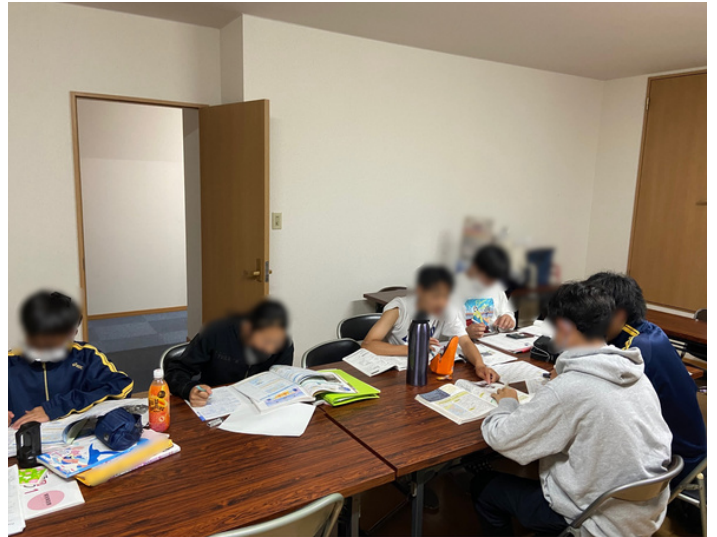
↑八丁平教室にて。学校のワーク提出も多くなってき

こちら、目的意識とステップ（何のために、何をどうするか）ということ、日々の指導の中に意識的に盛り込んでお話ししていきたいと思っております。引き続きよろしくお願ひいたします。