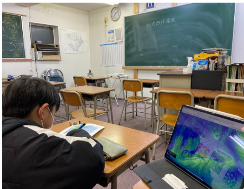
↑輪西本校では、Wi-Fi回線やデジタルデバイスを活用し、学びの個別最適化を図ります。写真は小3生、関心のある天気学習。